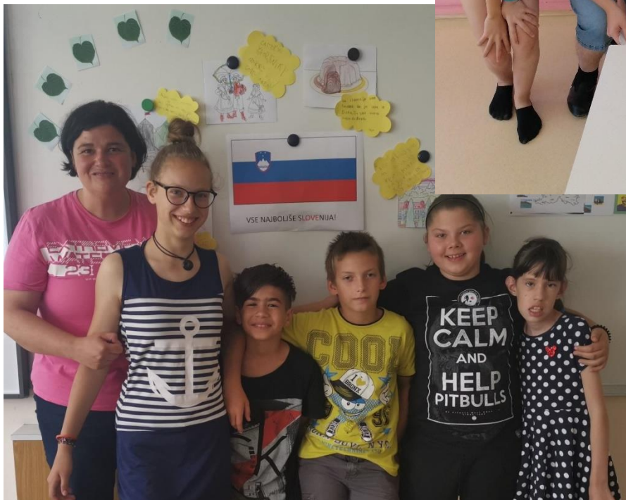
Slika 6: Smo veseli slovenski šolarji – 4. razred.