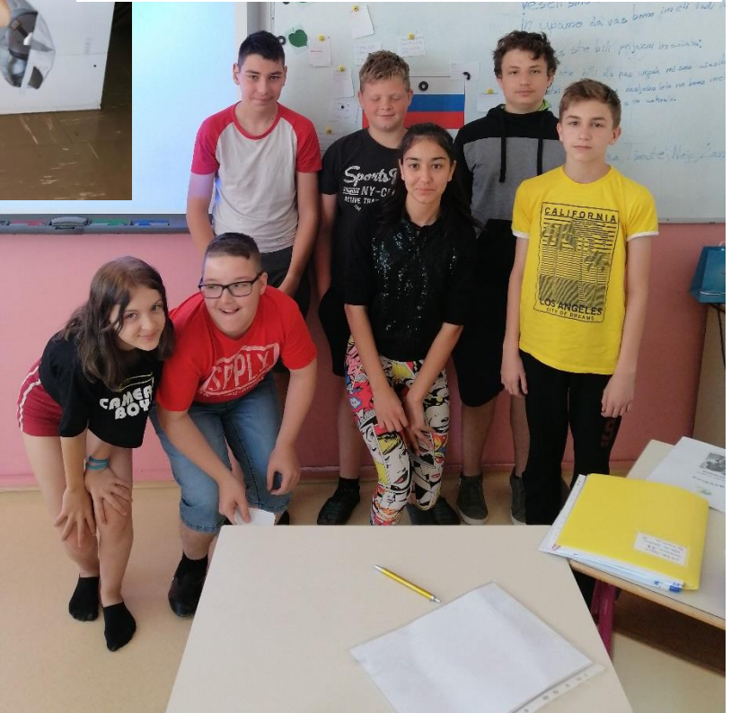
Slika 5: »Ker mi vemo zakaj..« - 7. b