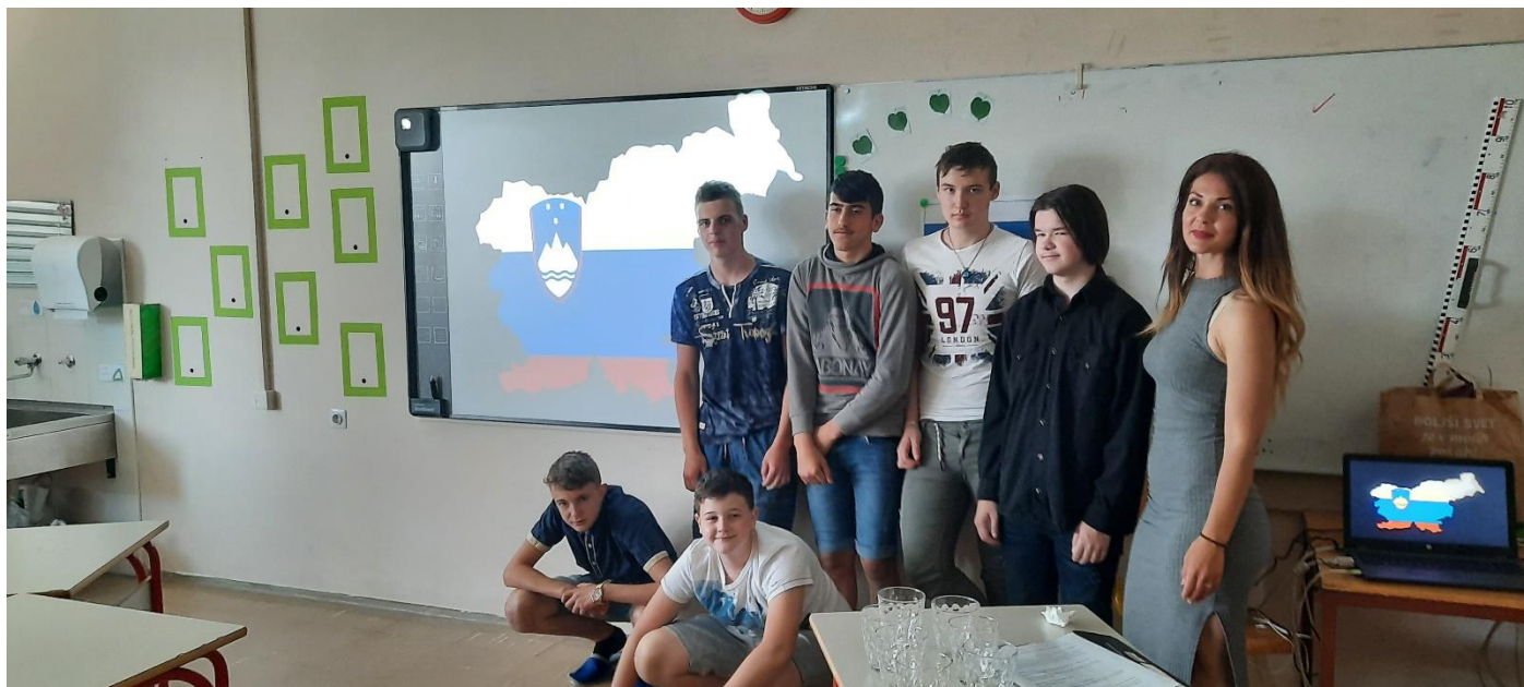
Slika 7: Najlepsi slovenski osmošolci.