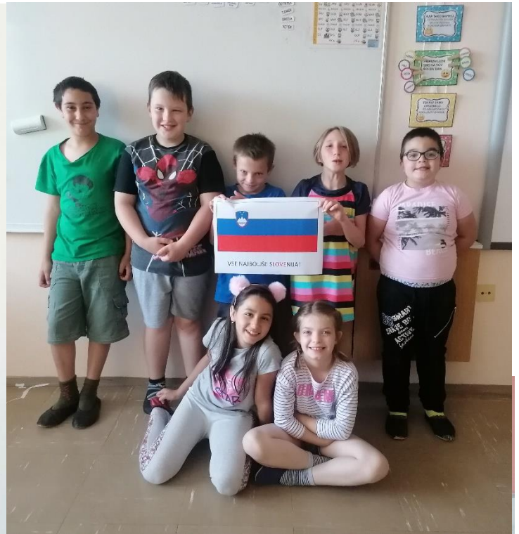
Slika 3: Naši najmlajši živahni in veseli s slovensko zastavo