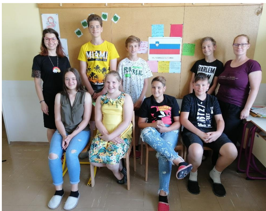
Slika 2: 6. razred s ponosom ob slovenski zastavi

Šolsko leto se je zaključilo v objemu pozitivnih misli, ki nas bodo toplo sprejele tudi septembra, ko se vrnemo v šolske klopi.