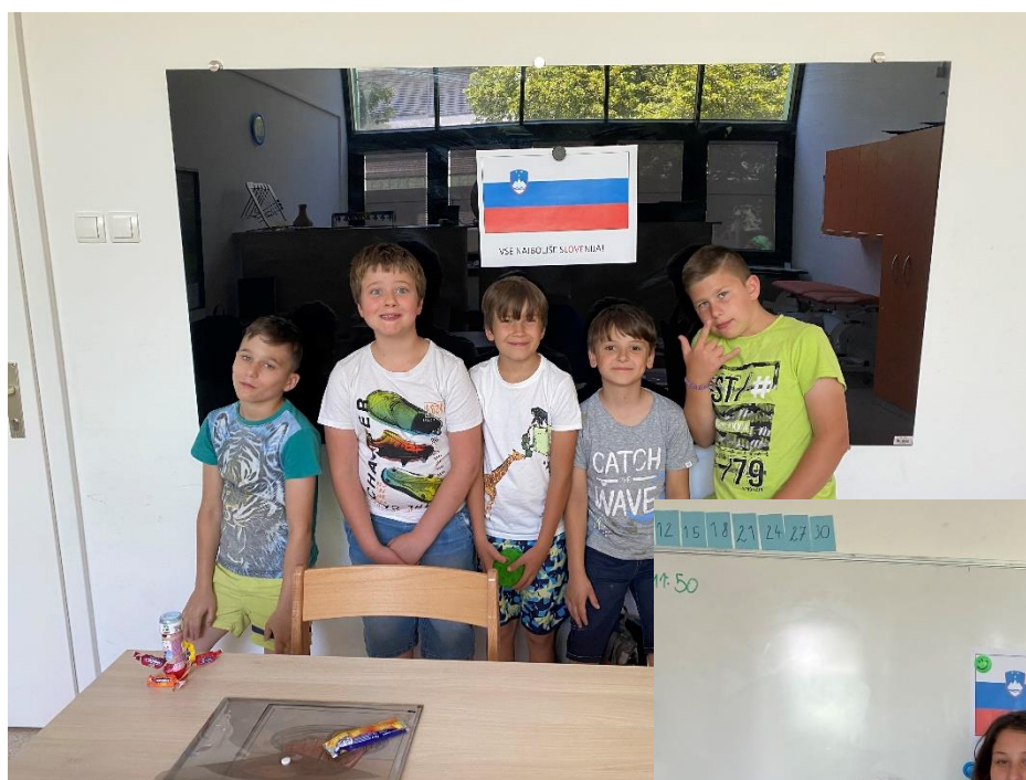
Slika 8: Tretješolci so utrjeno, a vseeno ponosno zapeli slovensko himno.