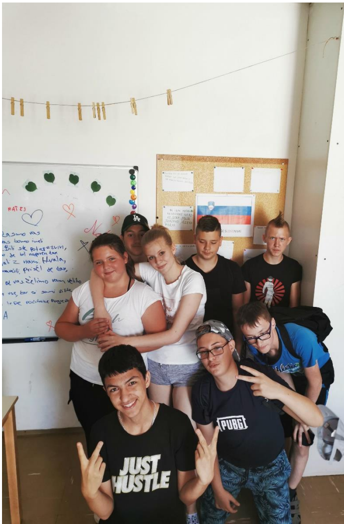
Slika 4: Radi imamo svoje sošolce, učitelje in svojo državo - 7. a