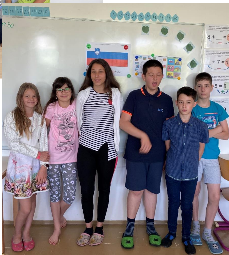
Figure 3: V 5. razredu pa eni ponosno in resno, drugi pa vedno veselo.